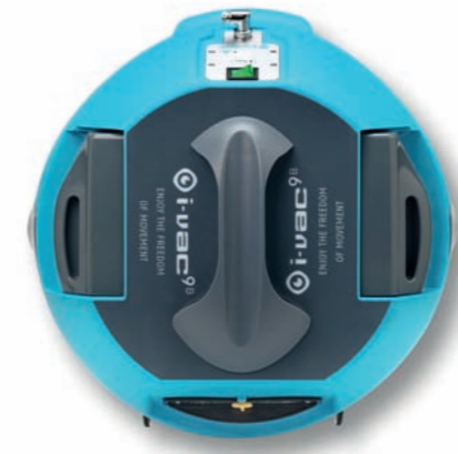
Baterías i-power 14

Sistema de dos ranuras para un tiempo de ejecución flexible de bien 40 minutos (batería i-power 14) u 80 minutos (dos baterías i-power 14). ¡Ya no estará atado a cables o enchufes!